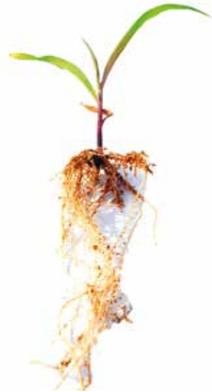
Deficiência de Nitrogênio