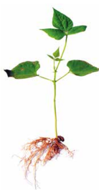
Deficiência de Enxofre