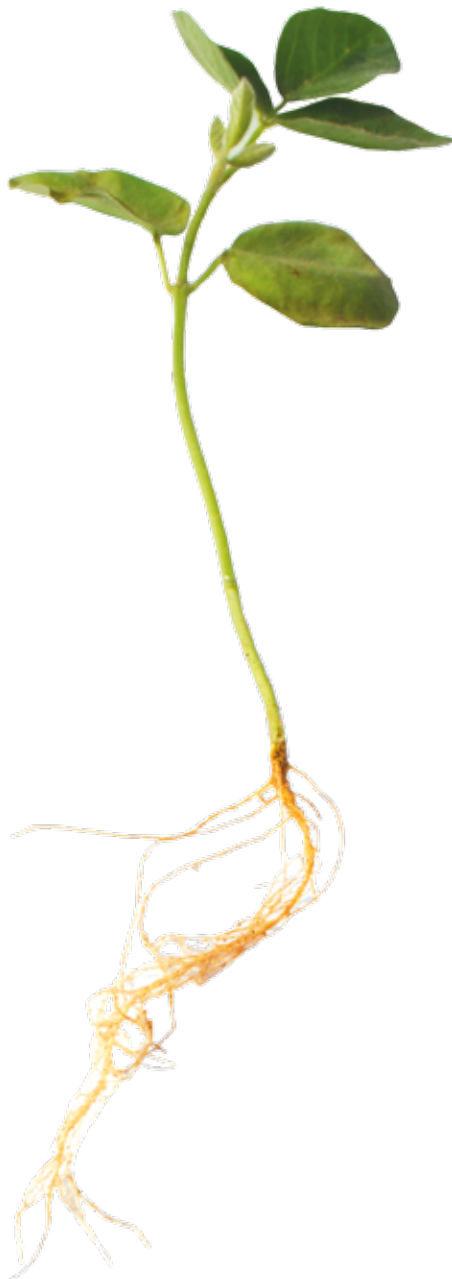
Figura 07: Sintoma de deficiência de Ferro em soja