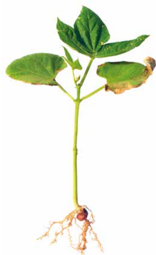
Figura 13: Sintoma de deficiência de Magnésio em feijão