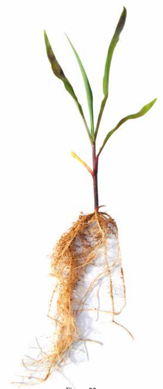
Figura 22: Sintoma de deficiência de Fósforo em milho