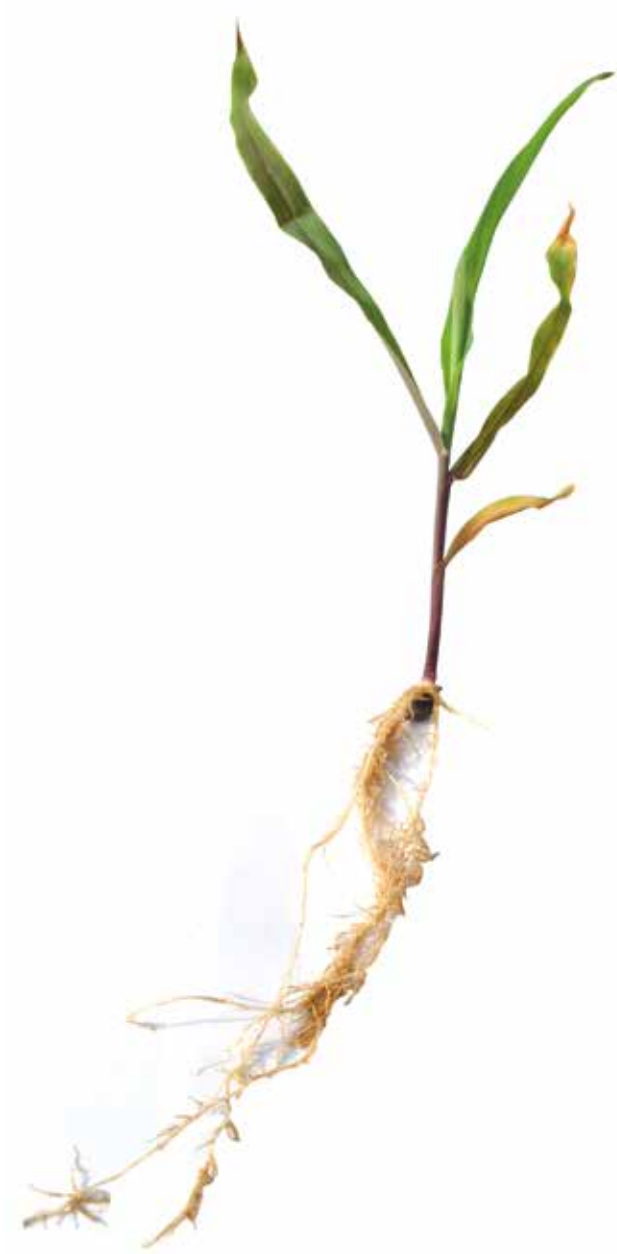
Figura 08: Sintoma de deficiência de Ferro em milho