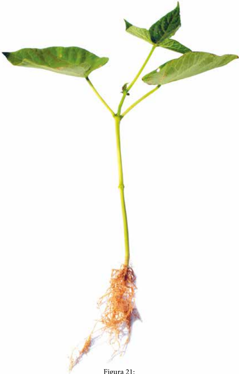
Figura 21: Sintoma de deficiência de Fósforo em feijão