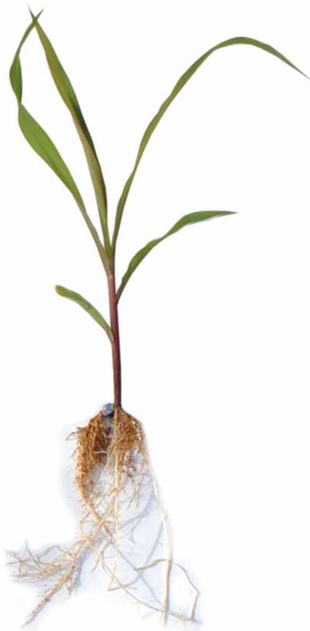
Figura 25: Sintoma de deficiência de Enxofre em milho