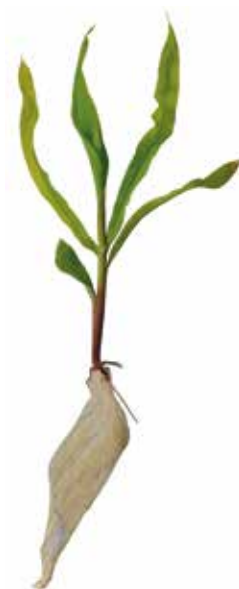
Deficiência de Magnésio