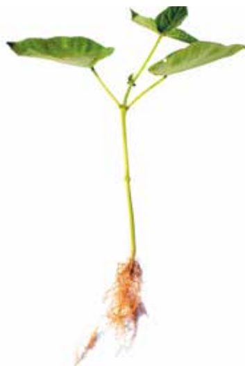
Deficiência de Fósforo