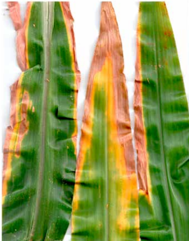
Figura 09: Sintoma de deficiência de Potássio em milho