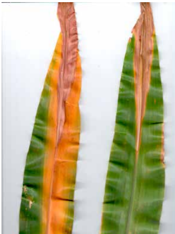
Figura 16: Sintoma de deficiência de Nitrogênio em milho