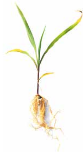
Deficiência de Potássio