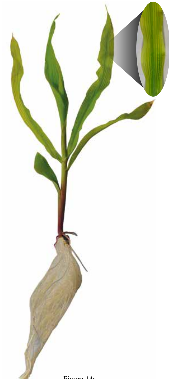
Figura 14: Sintoma de deficiência de Magnésio em milho