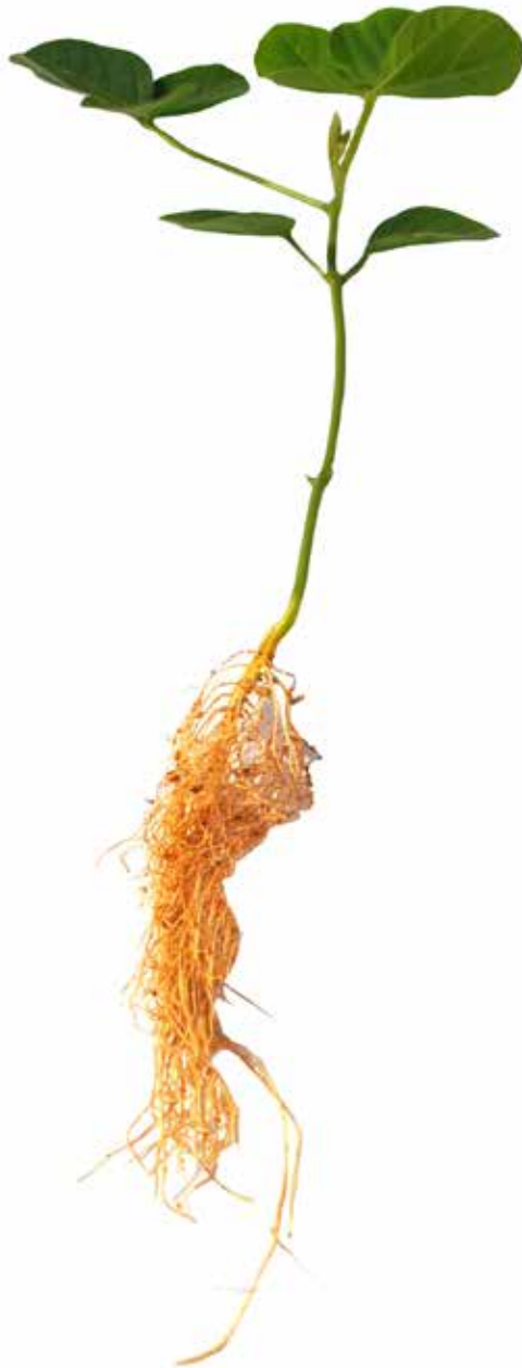
Figura 15: Sintoma de deficiência de Magnésio em soja