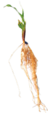
Deficiência de Cálcio