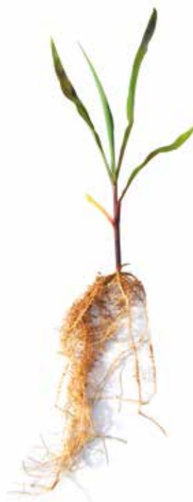
Deficiência de Fósforo