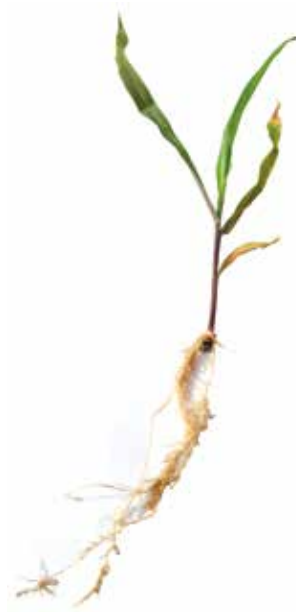
Deficiência de Ferro