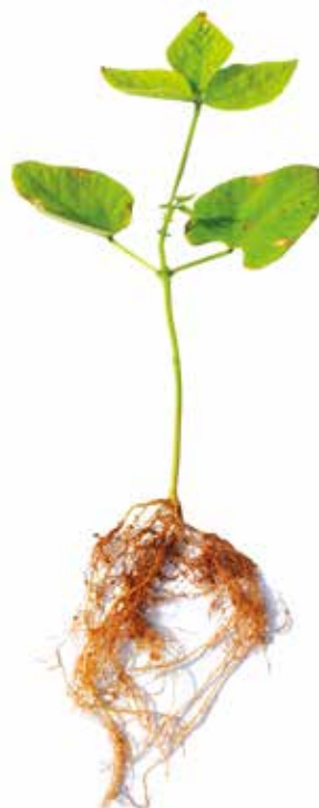
Deficiência de Nitrogênio