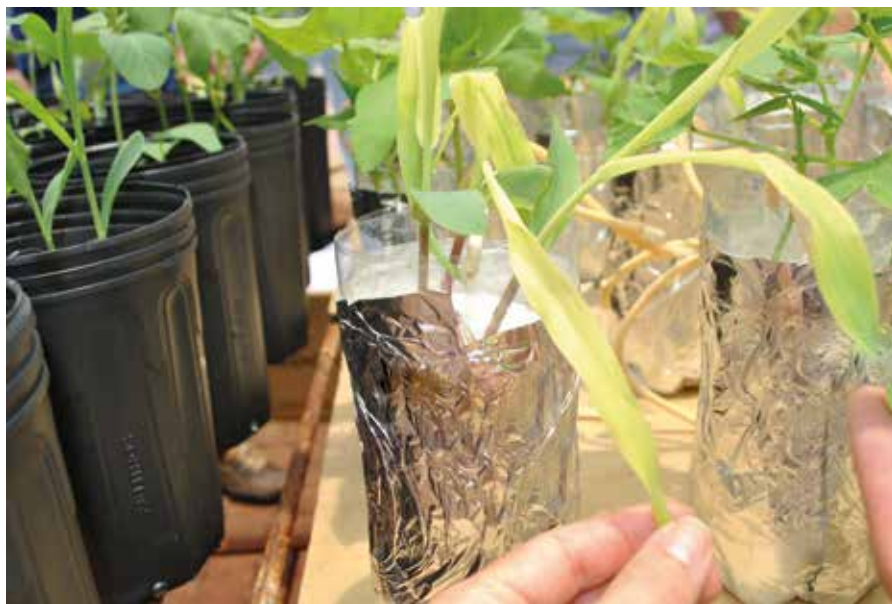
Figura 05: Sintoma de deficiência de Ferro em milho