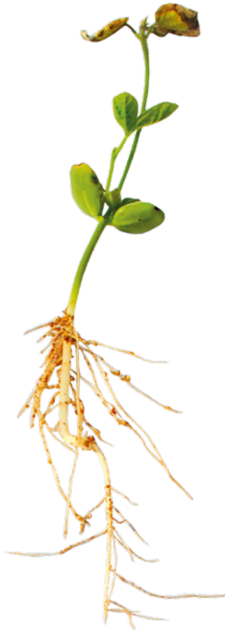
Figura 03: Sintoma de deficiência de Cálcio em soja