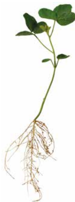
Deficiência de Enxofre