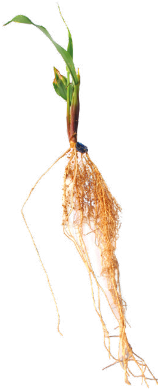
Figura 04: Sintoma de deficiência de Cálcio em milho