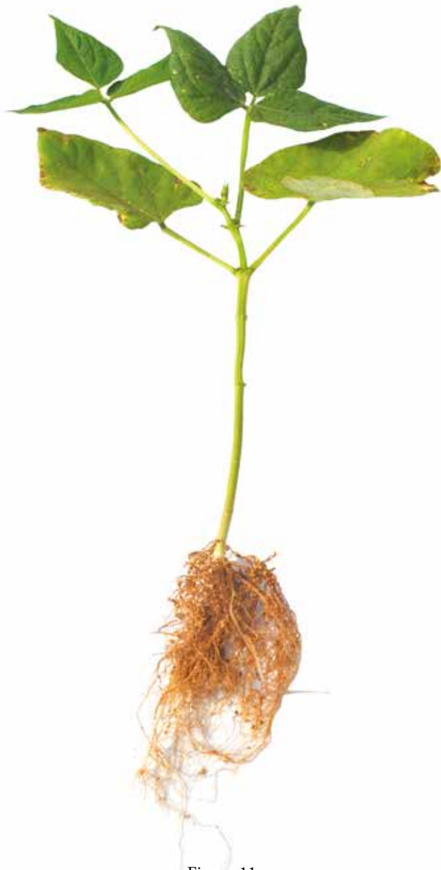
Figura 11: Sintoma de deficiência de Potássio em feijão