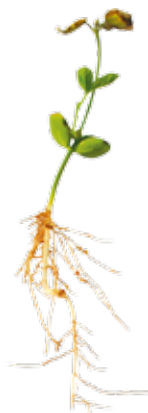
Deficiência de Cálcio