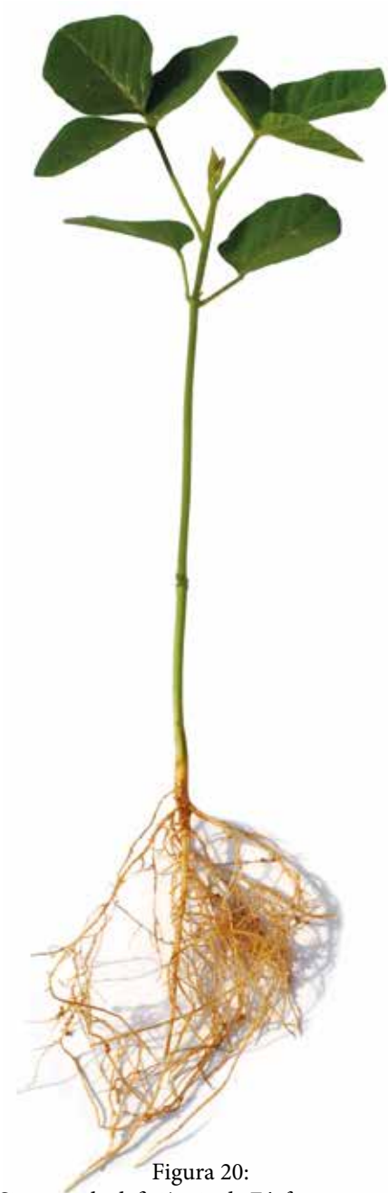
Figura 20: Sintoma de deficiência de Fósforo em soja