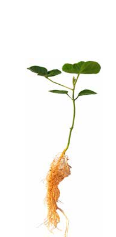
Deficiência de Magnésio