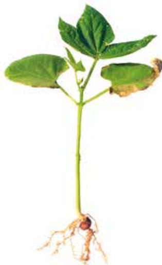
Deficiência de Magnésio