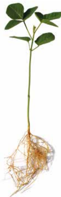
Deficiência de Fósforo