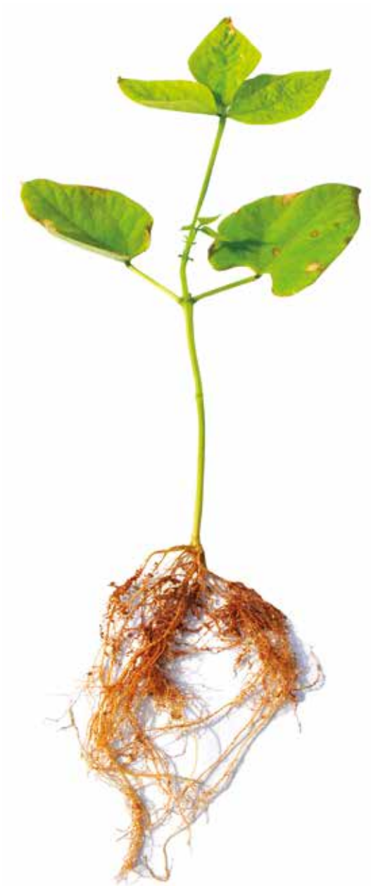
Figura 18: Sintoma de deficiência de Nitrogênio em feijão