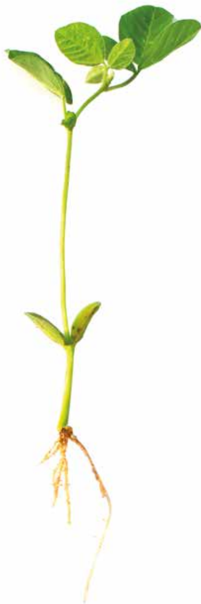
Figura 10: Sintoma de deficiência de Potássio em soja