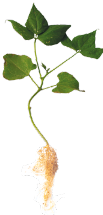
Deficiência de Ferro