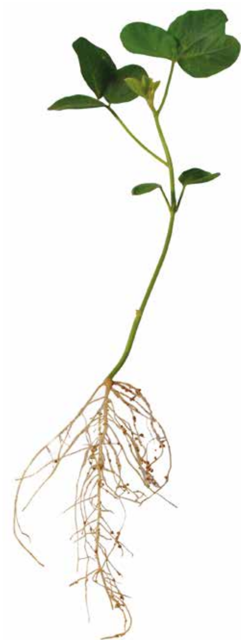
Figura 23: Sintoma de deficiência de Enxofre em soja