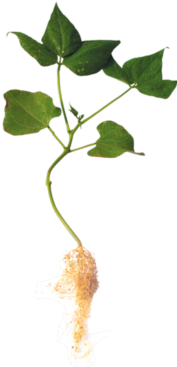
Figura 06: Sintoma de deficiência de Ferro em feijão