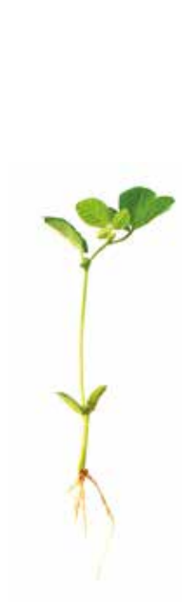
Deficiência de Potássio