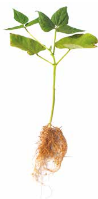
Deficiência de Potássio