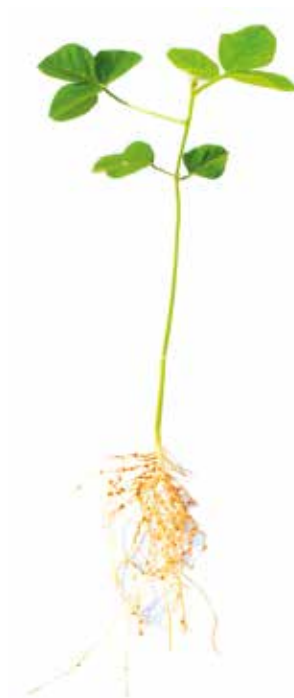
Deficiência de Nitrogênio