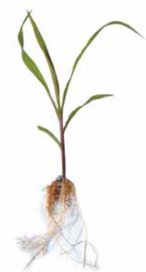
Deficiência de Enxofre