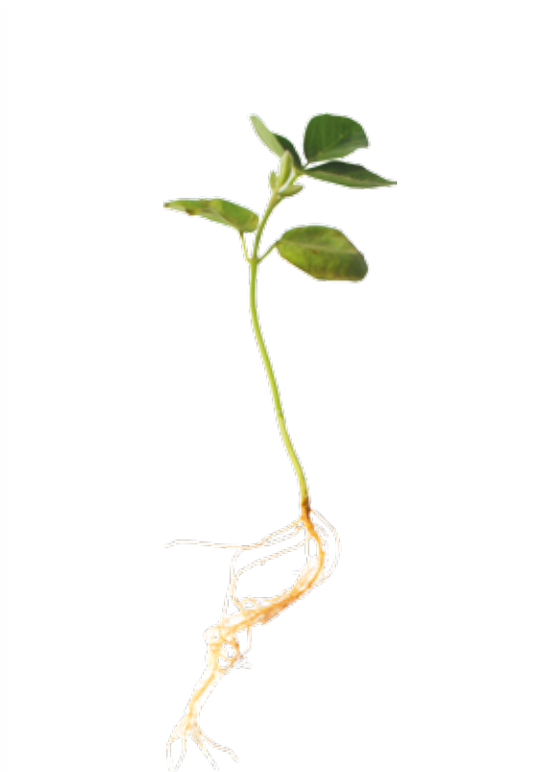
Deficiência de Ferro