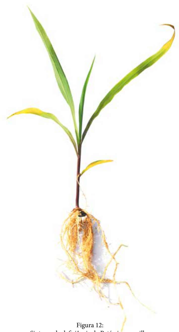
Figura 12: Sintoma de deficiência de Potássio em milho