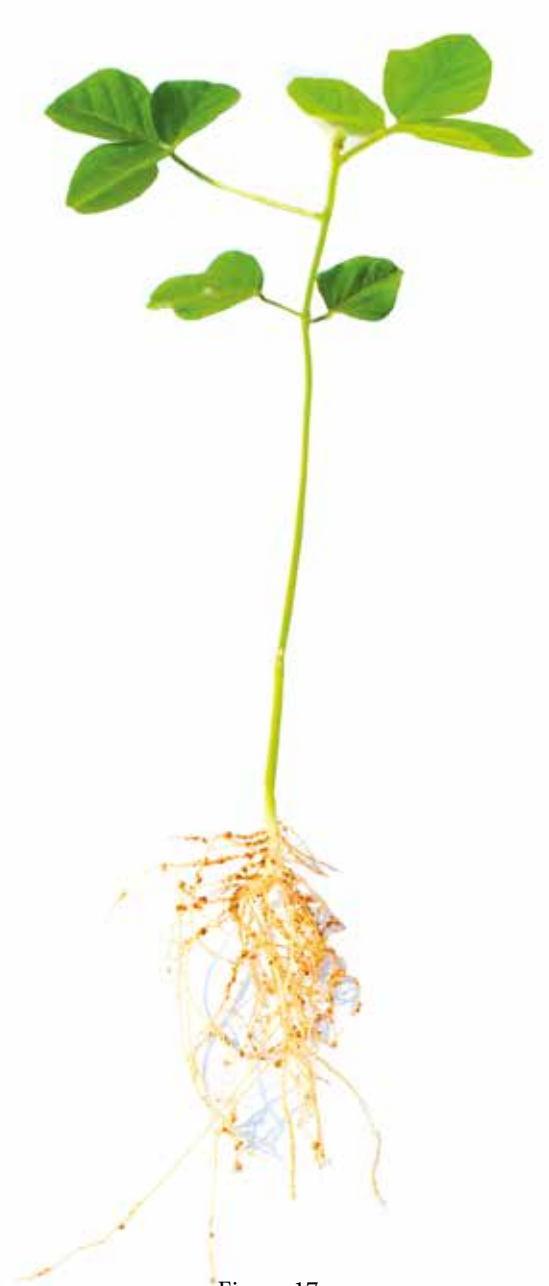
Figura 17: Sintoma de deficiência de Nitrogênio em soja