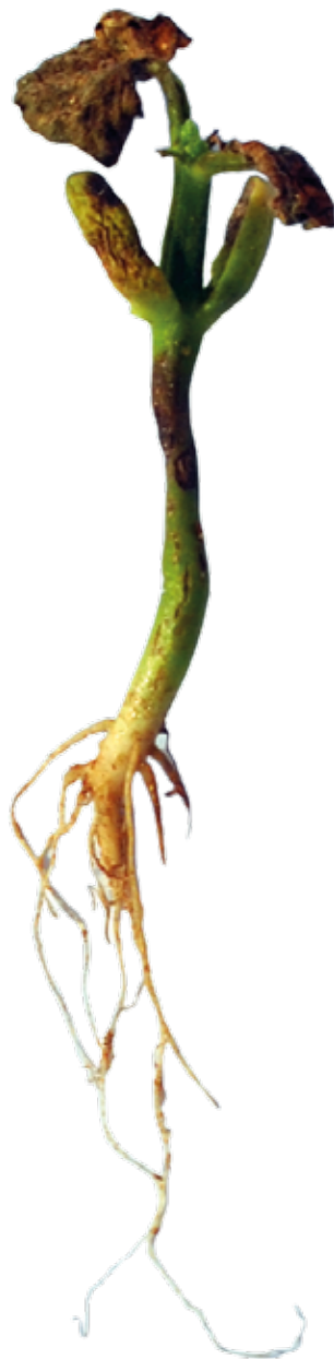
Figura 02: Sintoma de deficiência de Cálcio em feijão