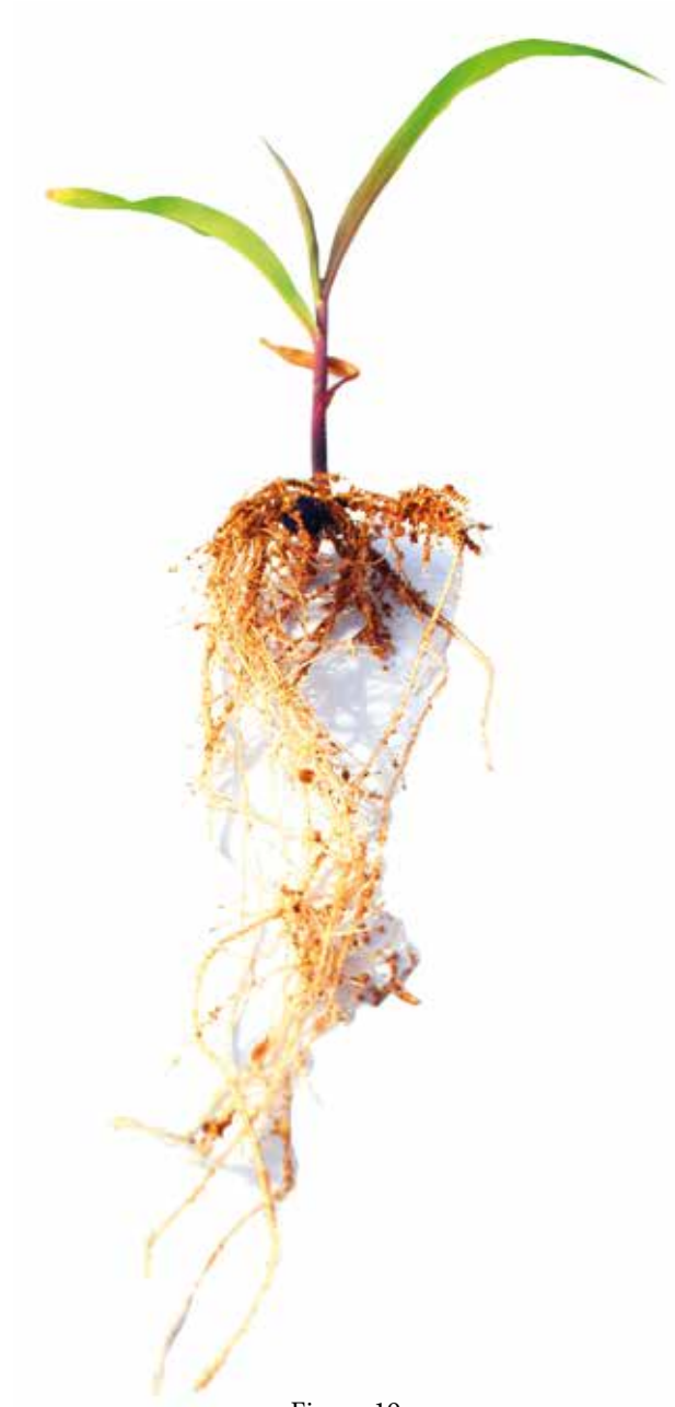
Figura 19: Sintoma de deficiência de Nitrogênio em milho